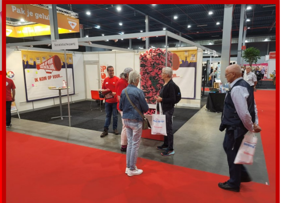
SP Leusden was op de 50-Plusbeurs en heeft vele goede gesprekken gehad!

Uitgave: Socialistische Partij Leusden en Woudenberg