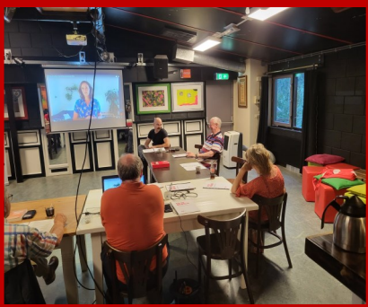
Algemene Ledenvergadering 9 september - Fort33