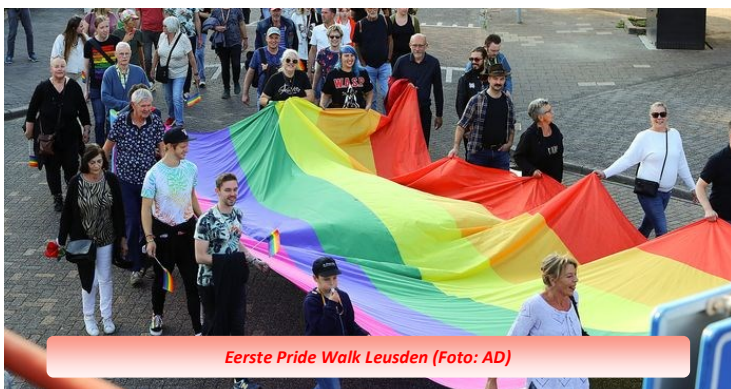
Eerste Pride Walk Leusden