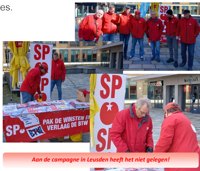
Aan de campagne in Leusden heeft het niet gelegen!

En ondanks dat wij allemaal, naast de Leusdense perikelen, ook de domper ervaren van de afgelopen Provinciale Statenverkiezingen zullen wij stug door gaan. Wij zullen in Leusden dan ook de strijd weer moeten opvoeren samen met elkaar, samen met inwoners en vooral met de gedachte dat een betere wereld kán. Ook in Leusden. Alleen begint deze wel in kleine stapjes.